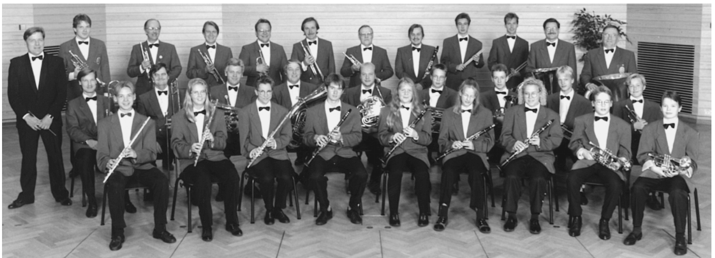
Die Ykspihlaja Band, Mitglied im Arbeitermusikverband STM, stellt ein typisches heutiges finnisches Blasorchester dar

auf ein immer größeres Interesse. Die stets vollen Konzertsäle sprechen eine klare Sprache, obwohl ein großer Teil der Zuhörer erst einen langen Anfahrtsweg auf sich nehmen muß. Von Helsinki aus benötigt man acht Autostunden, um in die »finnische Blechbläserhauptstadt« zu gelangen, denn Lieksa liegt im Osten Finnlands, nahe der Grenze zu Rußland. Aber auch das einheimische Publikum besucht die Veranstaltungen der Brass Week immer häufiger, was ein gutes Signal für die Zukunft ist. ■