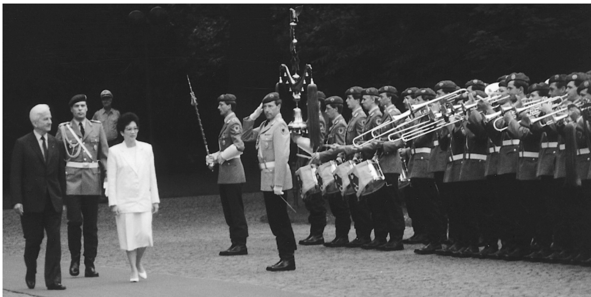
Protokolldienst in Bonn vor der Villa Hammerschmidt

tete. Bedauerlicherweise mußte ich diese Tätigkeit aus persönlichen Gründen aufgeben, weil ich einfach nicht mehr die Zeit dazu zur Verfügung habe. Mein Nachfolger ist ein Musiker des in Koblenz stationierten Heeresmusikkorps 300, der allerdings nicht Berufssoldat werden wollte, sondern auschied, Musiklehrer studierte und nun an verschiedenen Musikschulen tätig ist und in Nebentätigkeit weiter die Postkapelle Koblenz leitet.