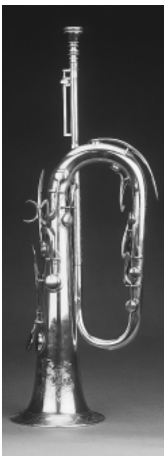
Abbildung 3: Graviertes Klappenhorn in tief F, E. G. Wright, Boston 1854

seltenen Schaustücken gehört auch das von oben zu drückende Drehventil-Kornett von Schreiber Cornet Mfg. Co. aus den USA, das wahrscheinlich kurz nach 1867 entstanden ist (Abbildung 4). Ein Prachtstück der Sammlung ist das reichverzierte Zarenhorn, das um 1884 von Joseph Schediva in Odessa (Rußland; heute Ukraine)