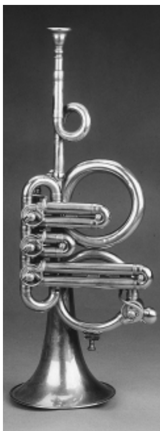
Abbildung 4: Drehventil-Kornett in B, Schreiber Cornet Mfg. Co. (USA), wahrscheinlich bald nach 1867