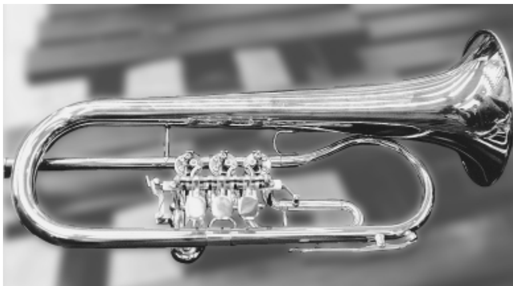
Flügelhorn mit Drehventilen

Dirigenten sehen allgemein in der rasanten Entwicklung der Blasmusik einen Niedergang bestimmter historisch gewachsener Klangeigenheiten zugunsten einer klanglichen Nivellierung. Neben den Es-Trompeten und der