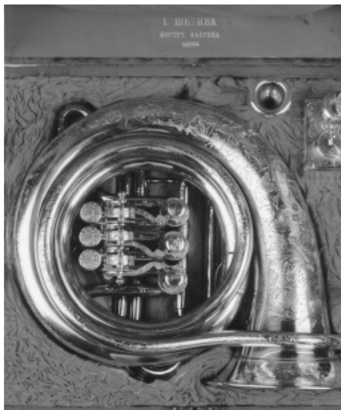
Abbildung 5: Reich verziertes Zarenhorn mit originalem Etui, Joseph Schediva, Odessa 1884

Vielfalt des Dargebotenen. Streitwieser hat nicht nur Historisches gesammelt, sondern auch Instrumente naturgetreu nachbauen lassen; so hat er etwa Schallplattenaufnahmen mit einem eigens für ihn geschaffenen Clarinhorn gemacht.