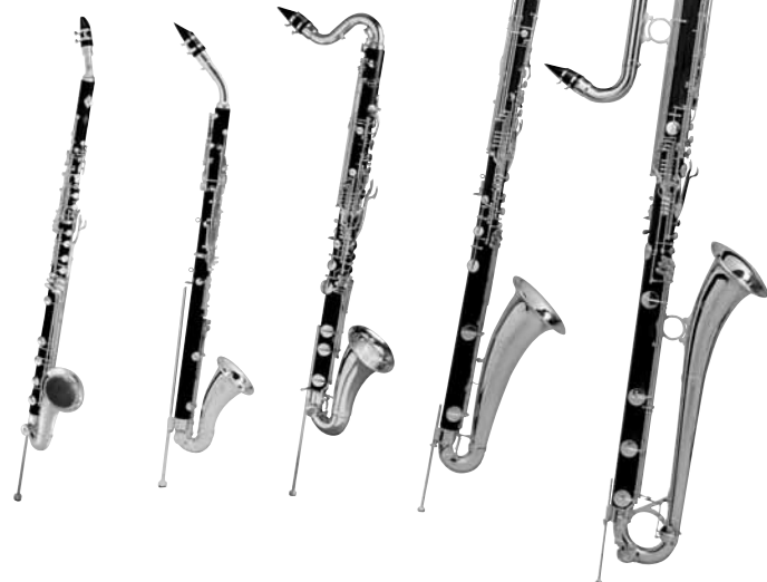
Die tiefen Familienmitglieder: Bassettthorn in F, Altklarinette in Es, Bassklarinette in B, Kontra-Altklarinette in Es und die Kontra-Bassklarinette in B.

In der Blasmusik sind die Klarinetten in B üblich. Sie werden generell mehrfach besetzt. In Bearbeitungen sinfonischer Werke übernehmen sie häufig die Geigenstimmen. Auch die Bassklarinetten in B wird immer mehr zum Standard im Bläserorchester. Meist ist sie mit ein oder zwei Instrumenten besetzt. Vereinzelt werden auch die Klarinette in Es und die Altklarinette in Es eingesetzt. Die Altklarinette ist immer noch sehr selten im Bläserorchester anzutreffen. Öfter sieht man aber die hohe Es-Klarinette, die wegen ihres durchdringenden Klangs nur einzeln besetzt wird.