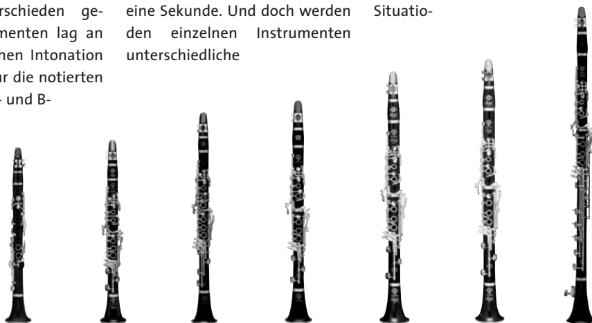
Klarinetten in verschiedenen Lagen und Stimmungen: Kleine Klarinette in As, Kleine Klarinette in Es, Kleine Klarinette in D, Klarinette in C, Klarinette in B, Klarinette in A, Bassettklarinetten in A.

Klangcharakteristika zugesprochen. Die B-Klarinette klingt glanzvoll, füllig, durchsichtig und leuchtend. Die A-Klarinette ist im Vergleich zur B-Klarinette zurückhaltender, sanfter und weicher. Im Vergleich zu B- und A-Klarinette wird die C-Klarinette als heller, kälter, härter und frecher beschrieben. Carl Baermann schreibt in seiner Klarinettenschule: »Nun ist der Ton der A- und C-Klarinette von so verschiedenem Charakter gegenüber der B-Klarinette, dass wenn ihm selbst die technische Bildung einer solchen Normal-Klarinette auf das Vollkommenste gelungen wäre, dieselbe doch nie bei den besseren Componisten Eingang gefunden hätte, da gerade durch die Tonwirkung der verschiedenen Clarinetten Effekte hervorgebracht werden, welche sich der mit feinstem Ton sinne begabte Componist nicht nehmen lassen wird.« Komponisten nutzten und nutzen bewusst die verschiedenen Klangeigenschaften der Klarinetten zur Darstellung von Situatio-