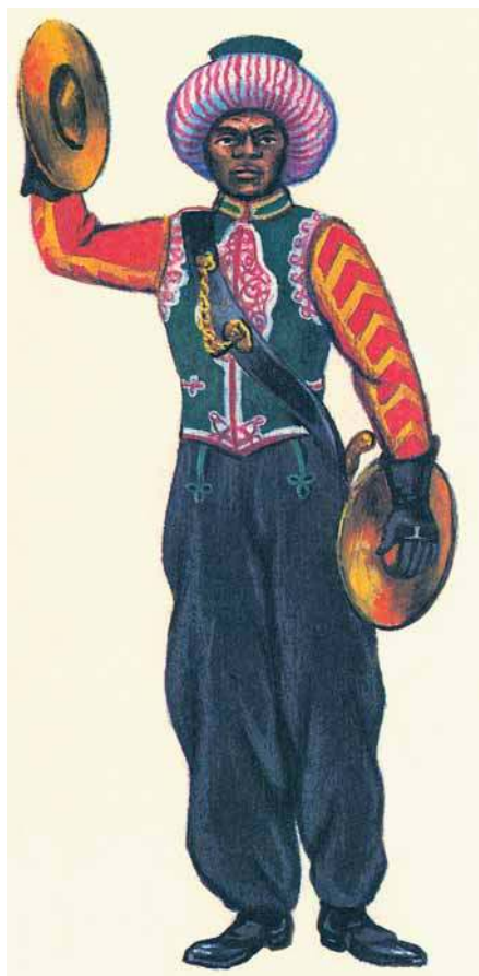
Janitscharenbeckenschläger des 1. Leichten Bataillons, Hannover, um 1808

Personenzahl her bescheiden, spielten die vier zusätzlichen Musiker Schalmeien, ähnlich penetrante Doppelrohrblattinstrumente wie der Dudelsack. Recht bald kamen die klanglich wesentlich angenehmeren, in Frankreich gerade entwickelten Oboen zum Zug. Nach ihnen hießen in Deutschland bis 1918 alle Infanteriemusiker »Hautboist«. Schon unter dem Großen Kurfürsten stießen Trompete und flache Trommel hinzu, um die Mitte des 18. Jahrhunderts ein Paar Waldhörner. Die Besetzung von je zwei Oboen, Hörnern, Fagotten und einer Trompete wurde als »Harmoniemusik« neben dem aus Pfeifern und Trommlern bestehenden Korps der Spielleute zum Grundstock der Militärmusik. Im