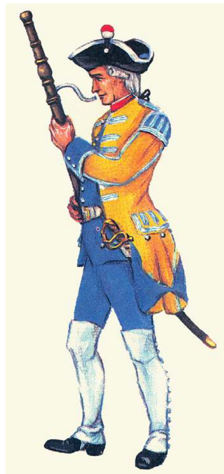
Hoboist des Leibgarderegiments, Sachsen, 1738 bis 1741