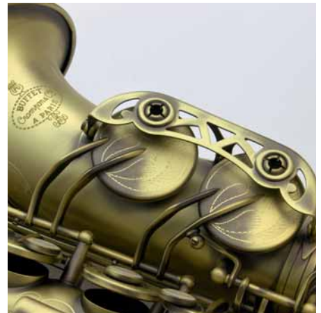
Die doppelten Bügel geben dem tiefen Register mehr Gefühl und Stabilität, denn sie tragen zur besseren Deckung bei.

Unser Tester hält das Instrument »für in sämtlichen Bereichen« einsetzbar, es ist für den Jazz genauso geeignet wie für die klassische Musik. Für (fortgeschrittene) Schüler ist das Altsaxophon »BC8401-4-0« von Buffet Crampon eine gute Wahl. Das Schlusswort hat unser Tester Guntram Bumiller: »Das Altsaxophon »BC8401-4-0« ist ein solides Mittelklasse-Instrument, dessen Klang für ein Instrument dieser Klasse sehr schön und flexibel ist. Ein paar Schwächen müssen jedoch hingenommen werden. Der Preis stimmt bei diesem Instrument.« Redaktion: Klaus Härtel