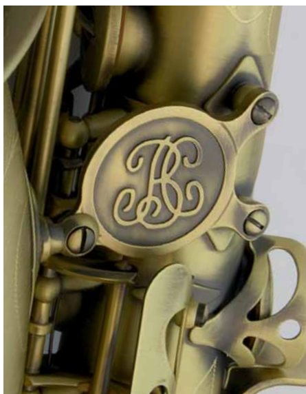
Auch das Buffet-Crampon-Logo erscheint in matter Antik-Optik.

Finish. Die Herstellung dieses hell-matten Looks wird durch die spezielle Behandlung der Oberflächen hervorgerufen. Zunächst wird die Oberfläche durch einen chemischen Prozess geschwärzt. Diese Verfärbung wird dann fast vollständig wieder heruntergebürstet und die Oberfläche danach mit einem transparenten Lack behandelt. Es ist wie so oft beim Design: hier entscheidet der persönliche Geschmack. Die Instrumentenbauer verwenden außerdem schwarze Filze als Dämpfer der Klappengeräusche sowie Perlmutterauflagen auf den Griffplatten.