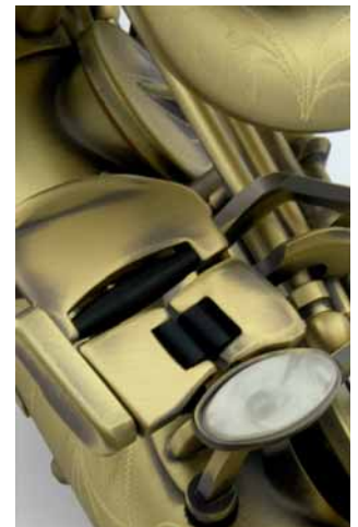
Die Rolle der h/b -Kippmechanik der linken Hand ist zu kurz geraten.