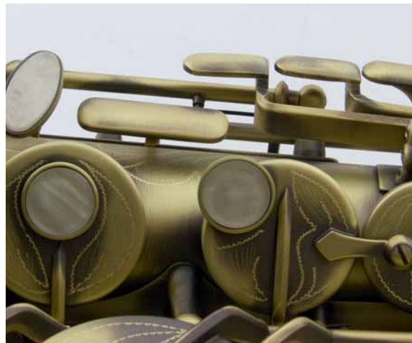
Die fis^3 -Klappe ist deutlich zu dicht am Korpus angebracht, was den schnellen Wechsel zu den High-Notes nahezu unmöglich macht.