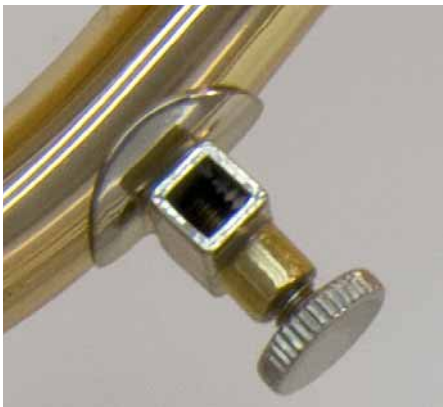
Durch das Notenhalterkästchen ist das Instrument auch marschtauglich.

ler oder auch Bläser mit einer kleineren Hand kann das Instrument gut halten und den Trigger ohne Probleme bedienen.«