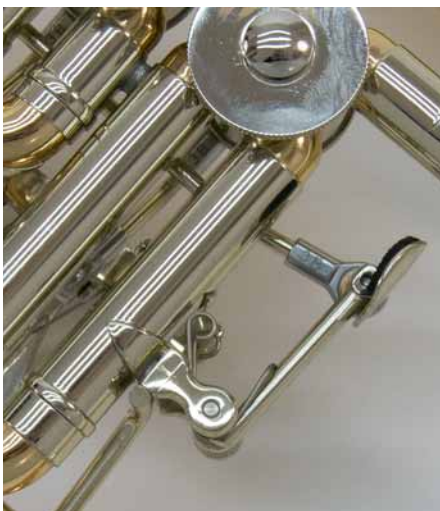
Der Tonausgleich ist durch die etwas herabgesetzte Drückerplatte zu bedienen.