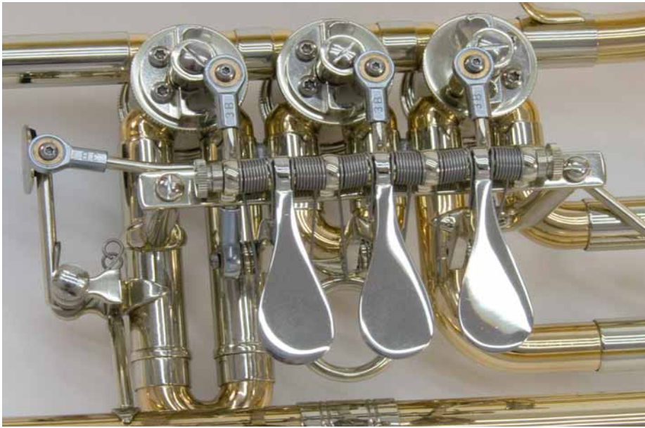
Die neue Maschine läuft leicht und das Trennungsverhalten bei schnellen Passagen ist sehr gut.

klasse. Und am 2. Flügelhorn kommt ein tiefes b oder a doch recht häufig vor.«