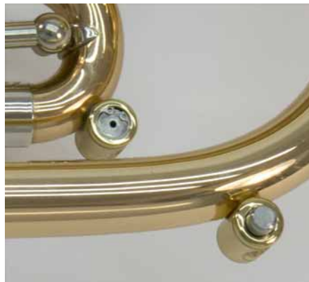
Die Amado-Wasserklappen sind optisch positiv, zum Wasserlassen etwas umständlich.

Durch das Notenhalterkästchen ist das Instrument auch marschtauglich und kann so flexibel für jeden Musikereinsatz verwendet werden. Ansonsten ist der Einsatzbereich