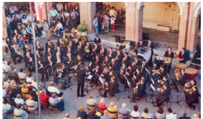
Die Banda Musicale Città di Gubbio bei einer Serenade im Kirchhof.

Der Journalist Cleto Bucci hat einige Höhepunkte der außerordentlichen Passions-Umzüge im süditalienischen Apulien beschrieben: »Die langsame Prozession der Statuenträger, die die Stadt viele Stunden lang durchquert; die »Stradari«, die die Ehre haben, in Molfetta die Prozessionen zu eröffnen; die Kreuzträger in Noicattaro, barfuß und mit Kapuze, niedergedrückt von schweren, schwarzen Kreuzen und mit Ketten um ihre Fußgelenke; die Kapuzen tragenden »Perduni«, die in Taranto (Tarent) von Grab zu Grab gehen; die Kapuzen tragenden und in weiße Tuniken gehüllten »Pappamuscì« in Francavilla Fontana; die Prozession der »Spina Santa« in Andria. In Ruvo di Puglia sind die Straßen mit weißen Tüchern bedeckt, wo die Prozession der »Ottosanti«-Statue durchzieht, getragen von 40 Männern – ein Privileg, das vom Vater auf den Sohn vererbt wird. Aber es ist wohl in San Marco in Lamis, wo die Karfreitags-Tragödie ihren Gipfel erreicht, wenn gewaltige, extrem schwere brennende Fackeln auf spezielle Karren geladen werden und der Statue der leidenden Jungfrau folgen, wobei die Flammen an den Wänden der Häuser reflektiert werden. – Und all