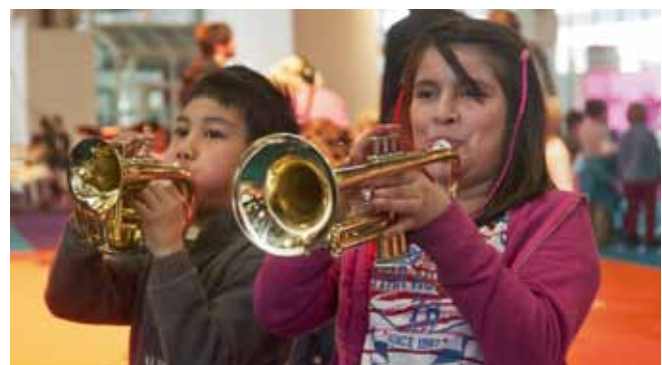
Die Frankfurter Musikmesse bietet »Music for Kids«. Ziel dabei: die Welt der Klänge erforschen.

Beim ehemaligen Süddeutschen Rundfunk gab es einmal eine regelmäßige Radiosendung mit dem Titel »Swingmobil – Jazzmusik für Kinder«. Da wurden kurze Jazzstücke gespielt mit kurzen Ansagen. Da erfuhr man wenig über die Musiker oder die Instrumente, aber gerade so viel über die Stücke, dass die Fantasie beschäftigt war. Ich erinnere mich, dass ich in dieser Kindersendung erstmals eine Aufnahme des Alt-saxophonisten Charlie Parker gehört habe, der als ein Begründer des Modern Jazz gilt. Das Stück hieß »My Little Suede Shoes«, hatte in der Melodie den Charme eines Kinderlieds und war mit lateinamerikanischer Percussion begleitet. Die Moderation beschränkte sich – soweit ich mich erinnere – weitgehend darauf, dass dieses Stück von Charlie Parkers Wildleder-Schuhen handelte. Es hat mich damals sehr beeindruckt, dass man über Wildleder-Schuhe so schön improvisieren kann. Ich sah Charlie Parker vor mir, wie er, tänzelnd in diesen weichen, gelblichen Schuhen, glücklich sein Saxofon bläst. Ich sehe ihn heute noch so, wenn ich »My Little Suede Shoes« höre. ■