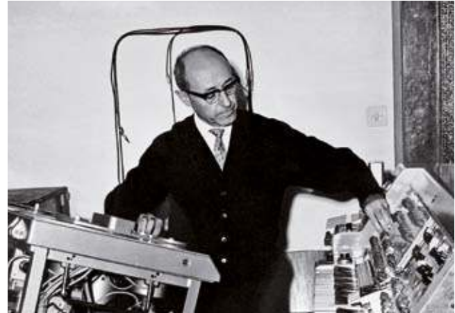
Josef Tal (1910 bis 2008)

keit führen. Deshalb verwendet man heute für diese musikalische Gattung die Termini »Neue Musik« oder »Elektroakustische Musik«. Speziell in der Tanzmusik, in der sogenannten »Clubmusik« oder dem »Discosound« fand die elektroakustische Musik vor allem in den 1980er Jahren große Verbreitung. »Techno« hat auf die Hörer einen richtigen Sog ausgeübt und war nicht nur eine kurze Modemusik, sondern bestimmt heute noch die Hörfunkprogramme und die CDs. Aber auch in der klassischen Musik haben sich Komponisten fest etabliert, die sich in ihrem Schaffen vorrangig der elektronischen zeitgenössischen Kunst widmen. Ihre Werke sind bei sogenannten Klangwerkstätten und in Konzerten für einen kleinen Kreis von Proselyten präsent. In der allgemeinen Kunstbetrachtung sind sie jedoch wichtige Impulsgeber, die die Moderne nach wie vor prägen und vor allem in den Medien eine wirkungsvolle Plattform für ihr Wirken finden. Die Liste der Komponisten, die ihr Schaffen neuen Wegen der Klang- und Formenfindung widmen, ist lang; ich möchte an dieser Stelle nur Karlheinz Stockhausen (1928 bis 2007) und Georg Katzer (geboren 1935) nennen. Beide Komponisten stehen für eine unerschütterliche Zuversicht in die Richtigkeit und die Nachhaltigkeit ihres kompositori-