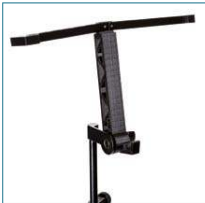
Der Tablet-Adapter ist eine Eigenkonstruktion von elephas systems. Das Tablet wird einfach von oben nach unten in den ausgeklappten Adapter geschoben.