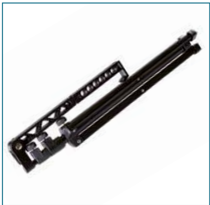
Zusammengeklappt passt der digitale Notenständer in jede Notenständertasche.