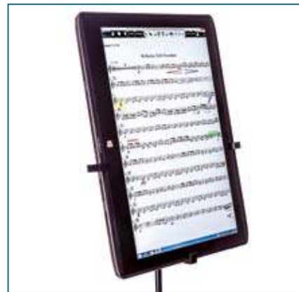
Die Noten werden im A4-Format angezeigt und können – genau wie Noten in Papierform – mit Einzeichnungen versehen werden.

Weitere Informationen zur Rechtslage finden Sie übrigens im Interview mit Dr. Johannes Ulbricht, Fachanwalt für Urheber- und Medienrecht, am Ende des Artikels.